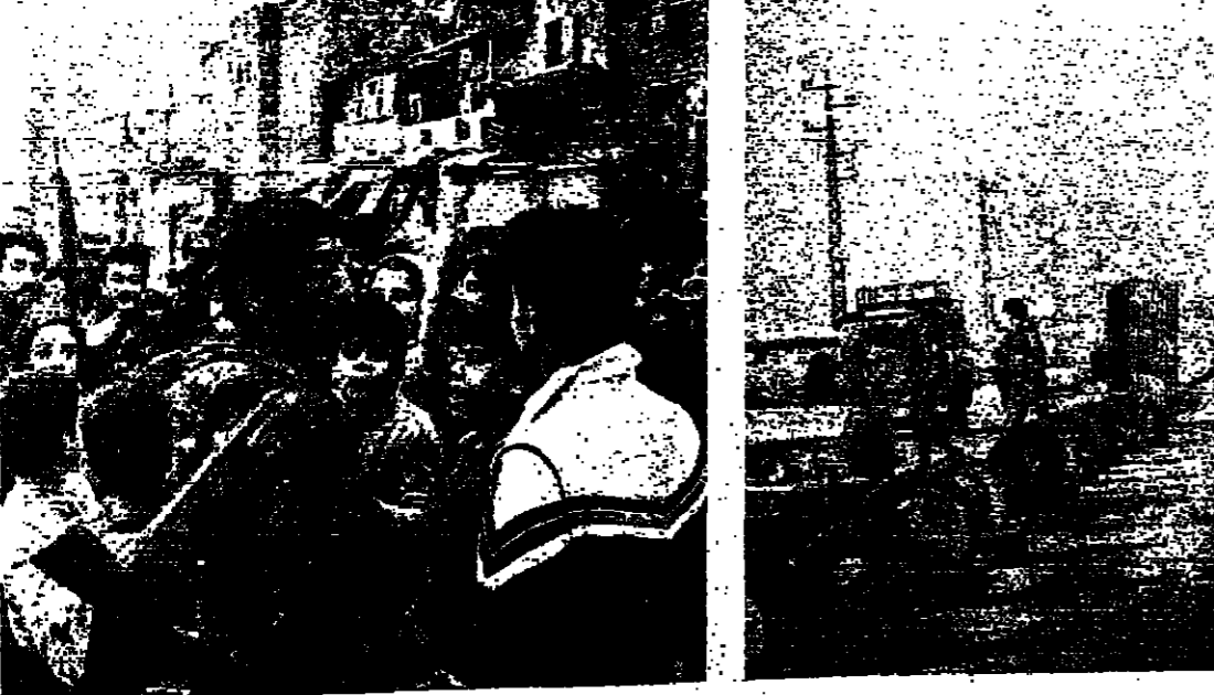
الجنود عند جسر الولى